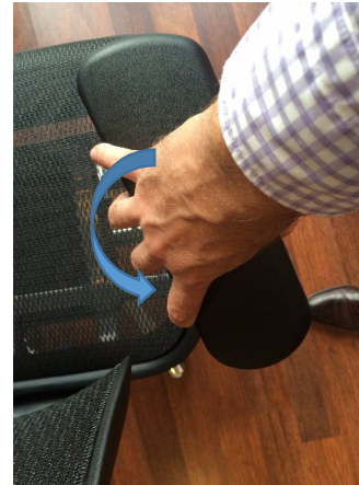
Aanpassing richting van de armleuning