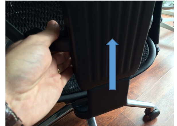
Aanpassing hoogte van de rugleuning