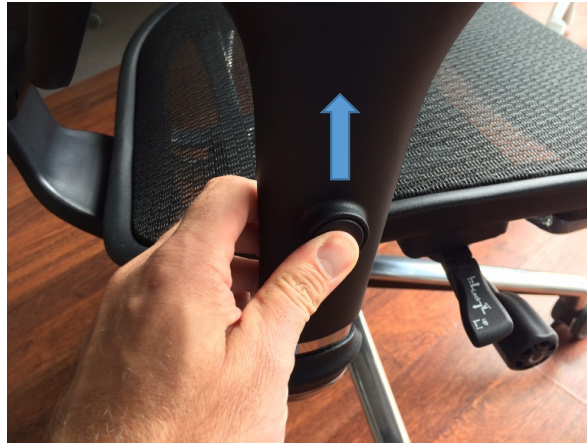
Aanpassing hoogte armleuning