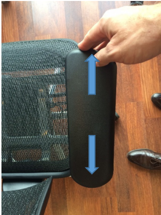
Aanpassing diepte van de armleuning