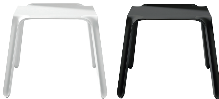
Legs: White 1734 C Top: White 8500