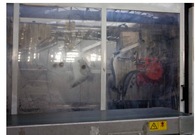
Processus de production and Designer chez Magis