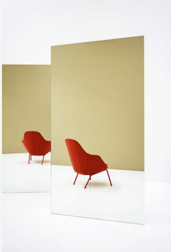
Dot (Armchair) by Patrick Norguet

Patrick Norguet è tra quei rari designer contemporanei che, attraverso una meticolosa attenzione ai dettagli, una visione globale e un'inimitabile cultura del progetto, riesce a trasformare anche il più semplice degli oggetti in un'idea di casa. L'ultimo prodotto disegnato dal designer francese raccoglie in sé i valori simbolici della casa ideale, traducendoli nelle morbide curve, geometrie avvolgenti, materiali tattili e strutture essenziali. Norguet ha disegnato una poltrona imbottita che richiama i prodotti più tradizionali, riconoscibili e apprezzati, trasformando i loro tratti familiari in un oggetto contemporaneo che riassume lo spirito del nostro tempo. Il progetto di Norguet è caratterizzato da una forma unica e continua, con lo schienale curvato che si trasforma con delicatezza in un elemento strutturale, mentre l'imbottitura conferisce la stabilità e il confort alla seduta, sollevata da terra da una contrastante forma architettonica che configura la base, disponibile sia in versione legno che in metallo.