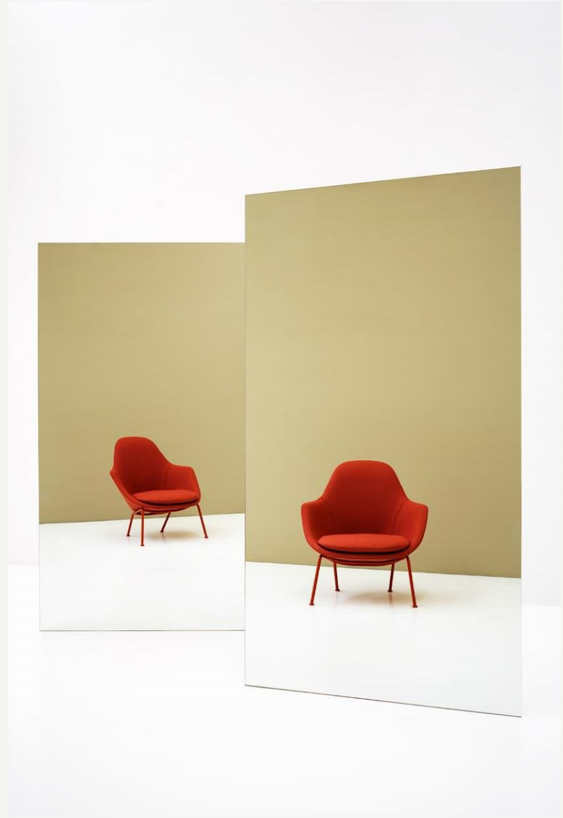
Dot — Technical Overview p.30