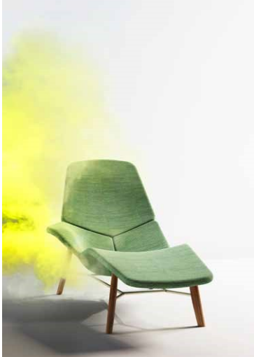
Atoll by Patrick Norguet

Come un accogliente arcipelago, composto da isole simili nella forma, la chaise longue Atoll è formata da quattro elementi distinti che creano un insieme avvolgente e rilassante, ma anche sorprendente nella sua originale asimmetria. Un bracciolo da un lato, una concavità aperta dall'altro, suggeriscono la possibilità di prendere più posizioni, ad esempio per riposare o per leggere, sempre nel rispetto dell'ergonomia naturale del corpo. Armonioso e caratterizzante anche l'abbinamento dei materiali: la seduta, rivestita in tessuto o pelle, poggia su una struttura in metallo, a sua volta sostenuta da quattro piedi in legno.