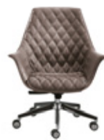
Imbottitura "romboidale" "Rhomboidal" pad

... raffinato design per l'ufficio presidenziale.