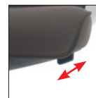
Blocco e sblocco oscillazione (3 posizioni) Tilt movement (3 positions)