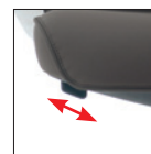
Alzo seduta Seat height adjustment