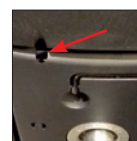
Regolazione eventuale intensità di oscillazione (con chiave in dotazione) Tilting tension adjustment (hex key included), if necessary