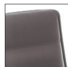
Sedile/schienale con cuciture lineari Linear stitching seat/backrest