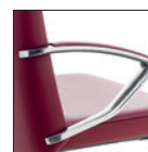
Bracciolo alluminio con soprabracciolo imbottito Aluminium arm with padded top