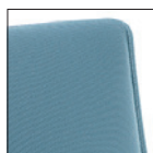
Sedile/schienale lisci Flat seat/backrest