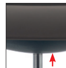
Meccanismo oscillazione sincronizzato autoregolante incorporato nel sedile (2° sedile/18° schienale) Self-weighting mechanism integrated in the seat (2° seat/18° backrest)