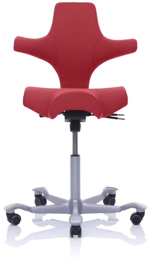
Design: Peter Opsvik. Modèle déposé et breveté